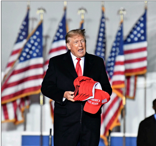
TRUMP HA DICHO que los procesos en su contra tienen motivación política.

Entre la fecha en que los documentos fueron llevados a la residencia y agosto de 2022, cuando el FBI los recuperó, Mar-a-Lago