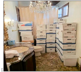
ALGUNOS DE LOS DOCUMENTOS fueron guardados en un baño, según la acusación.

Aunque no es claro que Trump vaya a terminar en la cárcel —los expertos concuerdan en que podría ser difícil probar los cargos que se le imputan— y el proceso podría tardar años; hay un efecto