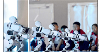
ESTUDIANTES observan robots en un centro educativo de inteligencia artificial en Handan, provincia china de Hebei.

AVANCES en la tecnología del reconocimiento facial y los software de síntesis de voces harán que el control de la imagen de uno mismo sea algo del pasado. La compañía Clearview IA anunció hace algún tiempo que conseguirá la capacidad de almacenar en su base de datos 100 millones de fotos de rostros, lo suficiente como para asegurar que casi cualquier persona en el mundo será identificable. Estos